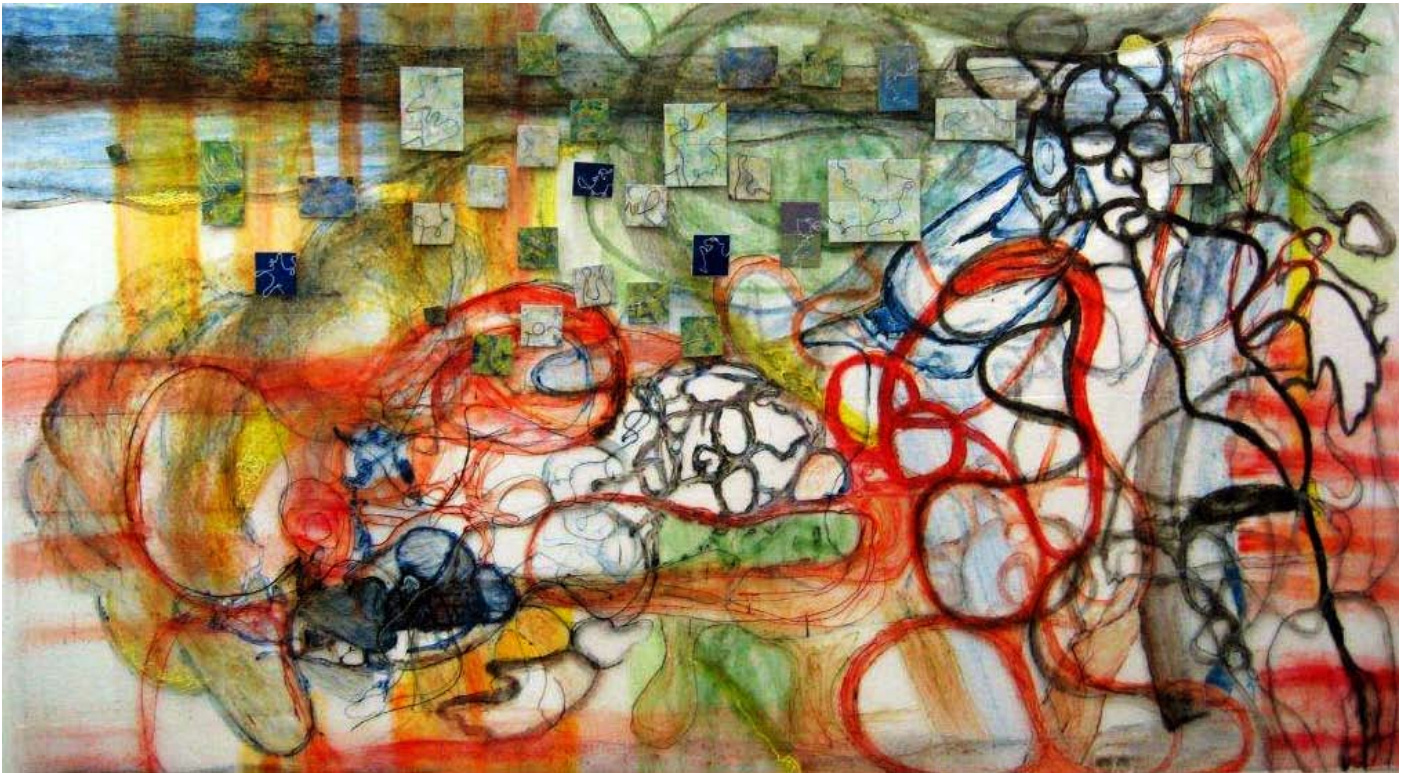
„Stücke – Draußen“, 2009, Acrylgel, Acryl-Malkarton, Draht, Folie, 200 x 350 cm