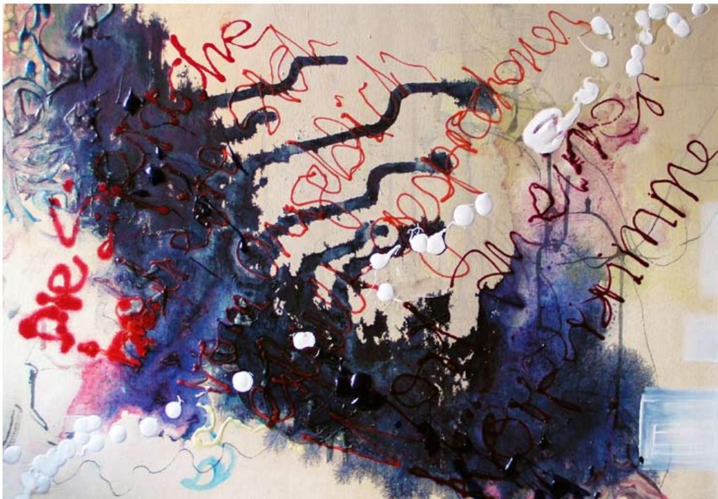
„Körperstimme“, 2010, Acryl, Gouache, Tusche, Acrylgel auf Leinwand, 50 x 70 cm