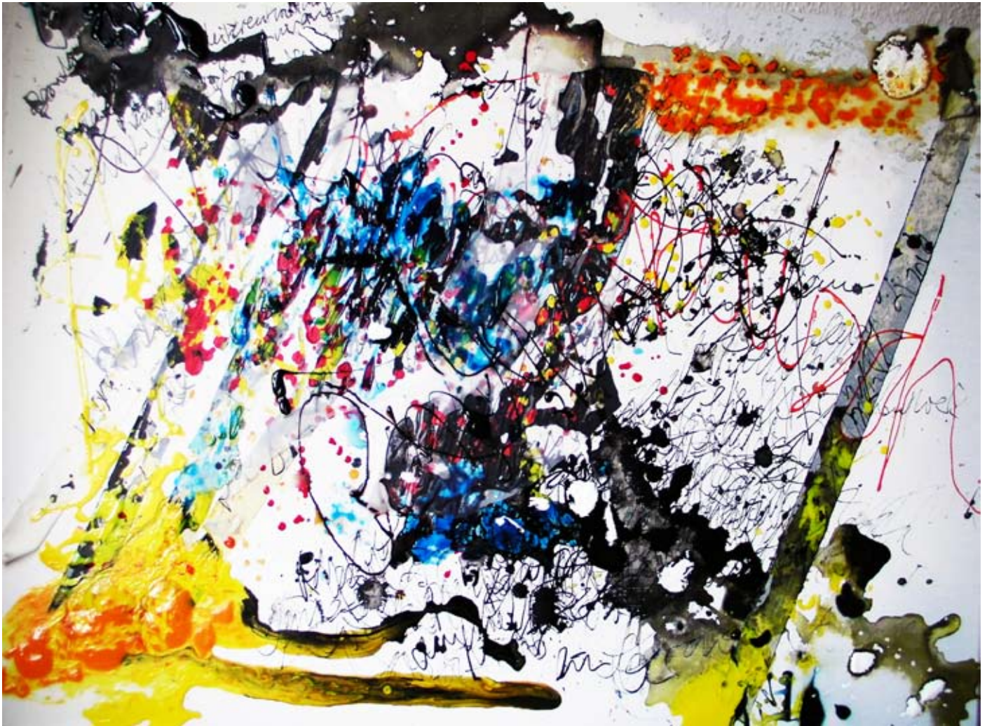
„Sprachrausch“, 2010, Acryl, Gouache, Tusche, Acrylgel, Papier auf Leinwand, 60 x 80 cm

Rechte Seite: „Kontakt Kommunikation Kollision“, 2010, Acryl, Gouache, Tusche, Acrylgel, Papier auf Leinwand, 120 x 120 cm