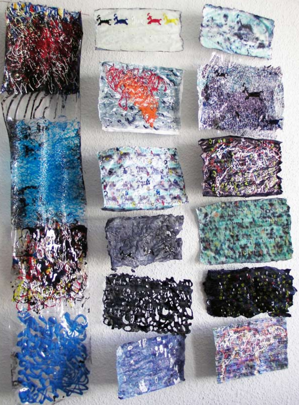
„Seit eine Frau mich schreibt“, 2010, Papier, Tusche, Tinte, Acrylgel, je 18 x 26; links: Folie, Draht, Acrylgel, 111 x 24